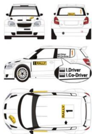
Ilustração 1 - Placas e números de Prova (art.9 das PER2021)